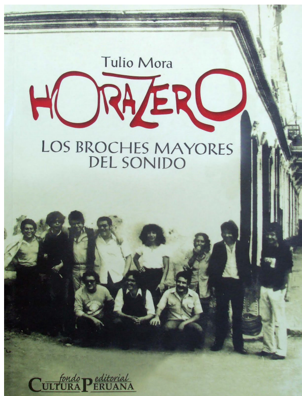
Portada del libro Hora Zero. Los broches mayores del sonido .

las particularidades de un momento histórico-social que el artista debe representar en su trabajo. La estética de la vida y la ética de la revolución encuentran en el texto de Bolaño una correspondencia inalienable: se debe “vivir” la poesía haciendo de ella una experiencia que ayude a subvertir desde su ejercicio una cotidianeidad que ignora aspectos determinantes de la realidad histórica: el infrarrealismo se presenta como “el ojo de la transición”. Tanto para los infrarrealistas como para los horazerianos, el poeta debe ser parte de la revolución creando una obra que se separe de los mandatos de lo canónicamente aceptado: lejos de los salones burgueses, por fuera de las academias, el poeta debe instalarse en los márgenes del poder y, desde allí, erosionarlo.