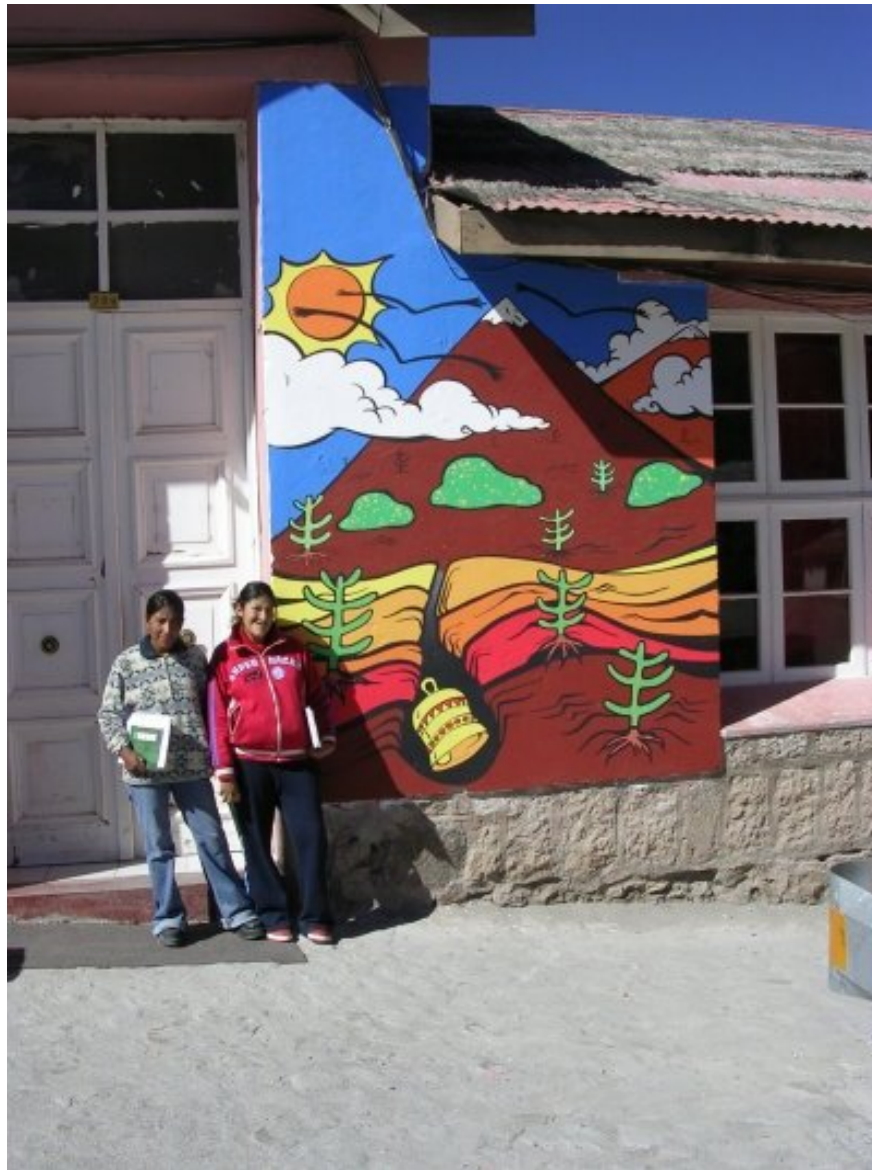
Casa de la Cultura de Putre