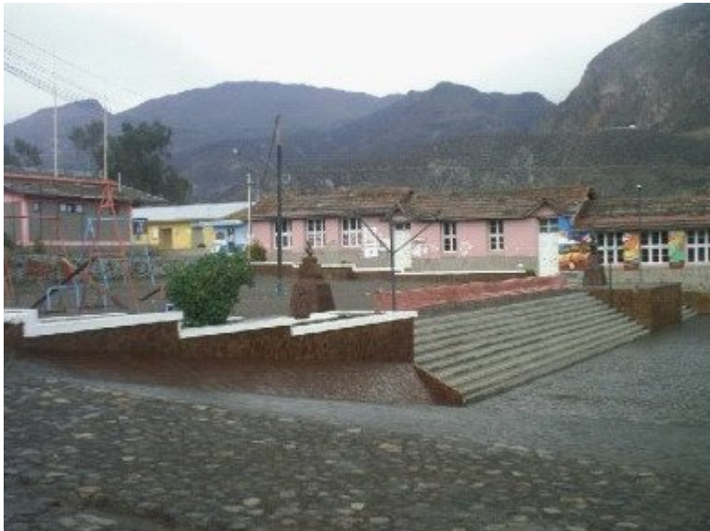
Plaza de Putre

Key words: community theater - Teatro de Tierra - Chilean theatre