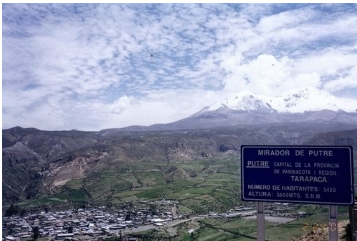
Vista de Putre