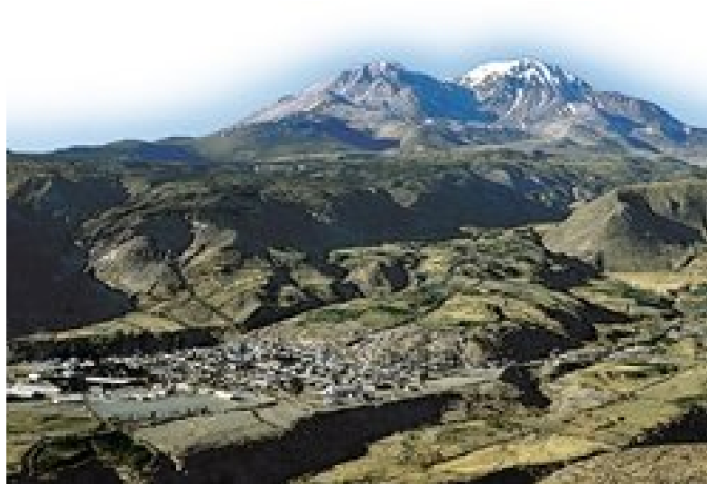
Vista de Putre