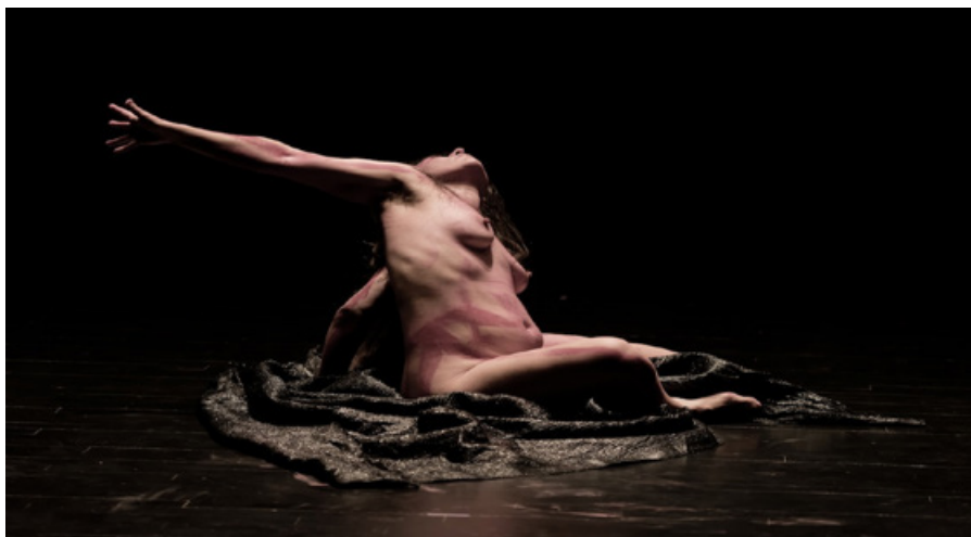
Otro teatro

de sus atributos de hombre o mujer, de sus gestualidades o comportamientos femeninos o masculinos. Recobrar una sexualidad más salvaje, más ritual y sobre todo, más placentera, dará otro sentido al cuerpo y al encuentro con otros cuerpos sin necesidad de poseerlos, de conquistarlos y, por tanto, de nombrarlos como homo, hetero, bi, trans y sus muchos etc. Sin necesidad de embanderarse ni siquiera de pronunciarse o de enmarcarse en una obra sobre género o sobre sexo, sin necesidad de embanderarse con uno u otro discurso sobre el género y el sexo, esta obra propone experimentar otro cuerpo, abriendo una brecha para desde la experiencia vivida y, solo desde allí, poder abordar otros modos de relación entre y con el ser cuerpos vivos, sexuados y sensibles. En una entrevista (Varela, 2014) Luciana Achugar dice: