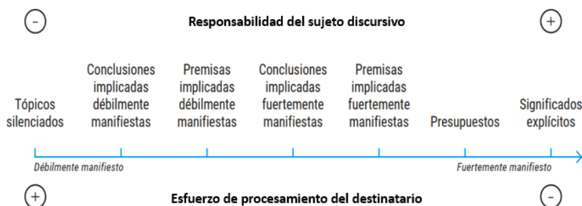
Gráfico 1. Grados de manifestación de significados. Elaboración propia a partir de Sperber y Wilson ([1986] 1994), Levinson (1983), Menéndez (2012) y Schröter (2013).

Consideramos que el principio de gradualidad de la manifestación de los significados puede complementarse con los aportes acerca de presuposición y silenciamiento previamente presentados y lo representamos gráficamente de la siguiente manera: