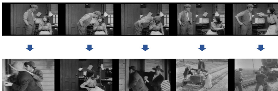
Figura 8. The Girl and Her Trust (1912).