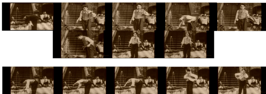
Figura 3. A Night Out (1915).

En el primer caso (figura 3), el personaje de Chaplin, completamente ebrio, baja al lobby de un hotel de categoría, confunde una fuente con una pileta de baño y comienza a bañarse: se lava los dientes, se hace buches, y se limpia partes del cuerpo con aquellos elementos que accidentalmente tiene a la mano.