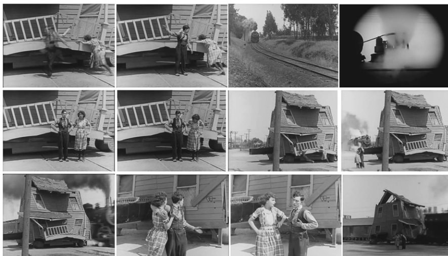
Figura 2. One Week (1920).

(a) El sujeto realiza una causa, descuidando algún factor que termina teniendo un impacto decisivo en el desenlace. Esta estrategia está estructurada en la asimetría esencial-secundario , y, por lo tanto, puede suceder que el sujeto se esmere en lo esencial, dejando de lado aspectos secundarios, que finalmente resultan esenciales en el desencadenamiento, o bien, a la inversa, que ponga el acento en aspectos insignificantes, descuidando aspectos fundamentales que estarían implicados. Un ejemplo excelente de este tipo es el desenlace del cortometraje de Buster Keaton de la figura 2, donde se ve a una pareja arrastrando una casa portátil, la cual queda atascada en las vías del tren; se escucha el tren a distancia y la pareja intenta con desesperación empujar la casa, sin lograrlo. Cuando el tren está a punto de llegar ambos personajes se abrazan aceptando lo inevitable, pero entonces el tren pasa por unas vías paralelas, que los personajes no habían advertido. Cuando empiezan a festejar su buena suerte, de golpe e imprevisto aparece un tren por la vía contraria, destrozando la casa.