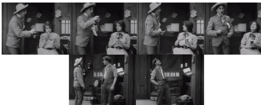
Figura 6. The Girl and Her Trust (1912).

La situación es bastante simple: se trata de un ofrecimiento que es en verdad una metáfora de cortejo amoroso. En el primer fotograma vemos a un varón ofrecer una bebida a la muchacha, que acepta el convite inicial. En el segundo fotograma, el varón extrae ahora dos sorbetes, ofreciendo uno a la muchacha, que también lo acepta. En el tercer fotograma aparece la inflexión o punto de conflicto, pues el muchacho ahora expresa su deseo de beber junto a ella, pidiendo colocar el segundo sorbete en la botella. En el cuarto fotograma vemos que la muchacha expresa su negativa por medio de una carcajada, revelándose que la pretensión del muchacho de conquistarla es —para ella— risible. La escena tiene una pequeña coda final donde el amante rechazado se cruza con el héroe, y comparte su desengaño. Cuando el muchacho se va, el héroe estalla también en una carcajada.