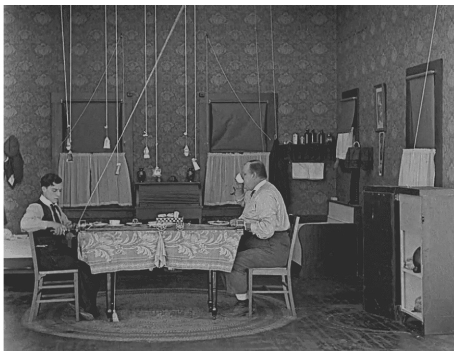
Figura 5. The Scarecrow (1921).

En el tercer caso (figura 5), se presenta una elaborada ingeniería cuya finalidad es agarrar un salero, sacar y destapar una botella. El gag reside en que la maquinaria puesta en juego constituye un esfuerzo de ingenio y un recurso excesivo para un resultado nimio que se podría haber realizado de un modo extremadamente simple.