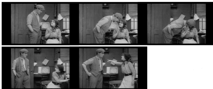
Figura 7. The Girl and Her Trust (1912).

Situación: el beso robado. Luego de la frustración del personaje cómico, vemos ahora al héroe ingresar a la oficina donde está la muchacha. Ahora es ella quien ofrece al varón una bebida, pero el héroe se aprovecha de un descuido y le roba un beso a la chica. Ésta se muestra ofendida y echa al héroe de la habitación (figura 7).