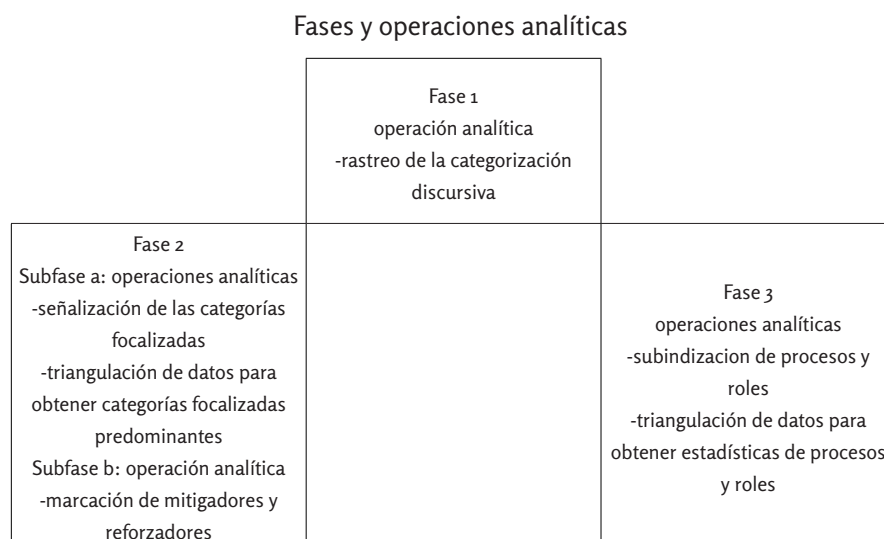
Figura 1. Diseño completo del Método de Abordajes Lingüísticos Convergentes para el ACD (MALC) 3 .

incorporan, respectivamente, el estudio de la jerarquización y de la tonalización de la información; mientras que la TRP agrega el examen de los procesos y de los roles participantes. Cada fase posee procedimientos (operaciones). La figura 1 presenta el diseño completo del MALC.