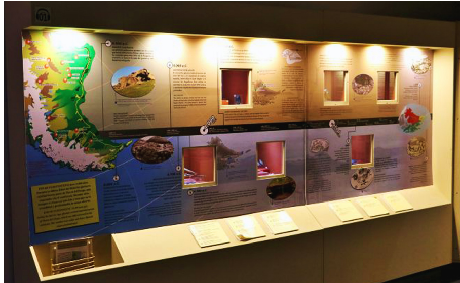
Figura 3: Fotografía de la vitrina arqueológica dedicada al poblamiento inicial de la región fueguina.

Al analizar esta colección arqueológica encontramos que se incluyen artefactos especialmente referidos a la subsistencia cazadora: los vinculados a los cazadores del norte de la isla están dedicados a la subsistencia cazadora terrestre, en tanto los procedentes de la región del canal Beagle denotan una subsistencia más centrada en los recursos marinos (relacionados con el uso de arpones) pero también terrestres (relacionados con el uso de puntas líticas). Sin embargo, la colección canoera también muestra un punzón en hueso de ave, artefacto ubicuo en los sitios del canal Beagle (Orquera y Piana, 2015), utilizado presumiblemente para la confección de cestas de junco. Este objeto referencia así la recolección de vegetales y/o moluscos que se efectuaba con cestas.