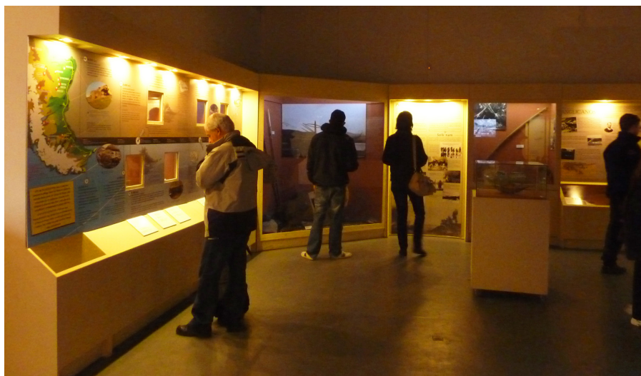
Figura 2: Fotografía general de la exhibición permanente del Museo del Fin del Mundo.

La exposición principal de la sede “Banco Nación” se compone de seis secciones, que abarcan: (1) la flora y fauna autóctona; (2) el primer poblamiento de la región patagónico-fueguina; (3) los Pueblos Originarios Fueguinos –Selk’nam y Yámana–; (4) los misioneros anglicanos y salesianos; (5) los exploradores marinos y terrestres; y (6) los naufragios (ver Figura 2). De éstas, las secciones #2 y #3 son las secciones antropológicas/arqueológicas que analizaremos aquí.