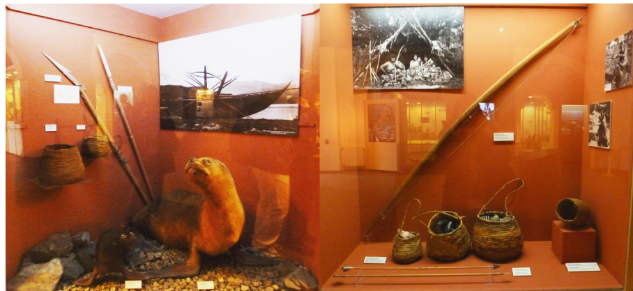
Figura 4: Fotografía de las vitrinas yámana y selk'nam.

puesta en escena de dos lobos marinos ( Otaria flavescens ) embalsamados –un adulto y una cría–, en un espacio de rocas que simula la costa del canal Beagle. En la pared de la derecha de la vitrina se exhibe una fotografía etnográfica que muestra una gran canoa yámana en una playa de guijarros con varios arpones y remos entrelazados. Sobre la pared izquierda se exhiben dos arpones: uno con punta ósea monodentada y otro con punta ósea multidentada; según información provista en los epígrafes, se trata de réplicas contemporáneas. Al lado de los arpones, sobre dos pequeñas repisas de acrílico, se exhiben dos cestas de diferentes tamaños, cuyos epígrafes informan que están confeccionadas con junco mediante técnica de espiral, pero no mencionan su autoría, por lo que su carácter etnográfico es inferible a partir de que no se trataría de artefactos arqueológicos (debido a que su materia prima impediría su preservación) y tampoco son señalados como réplicas, como sí lo son los arpones.