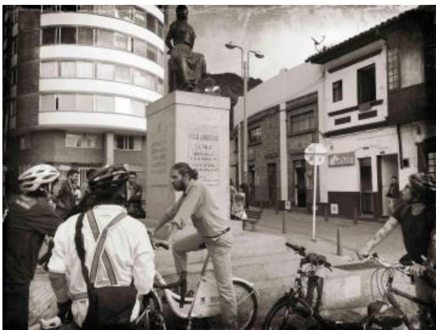
Figura 4. Bicicorrido en estación La Pola (Eje Ambiental Carrera 3 con Calle 18).

para transmitir voces relacionadas con las mujeres, ocultas tras la piedra lapidaria del olvido. Concentrada la atención en los relatos que las sitúan en la escena urbana, hicieron presencia hombres y mujeres, niñas, adultas y adultos mayores, en total 40 personas en un 80% mujeres. Con un grupo etéreo heterogéneo y con poco o nulo conocimiento sobre el tema, se dio inicio arrancando con la visita a La Rebeca (Figura 3). Estación tras estación, aumentaba su interés percibido en el diálogo estacionario dando muestras de comprender cada vez mejor los vacíos referidos en la historia que se cuenta sin enfoque de género. Acción efectiva para conectar a las mujeres con la ciudad mediante una lectura transversal y la adquisición de herramientas para ahondar en ello.