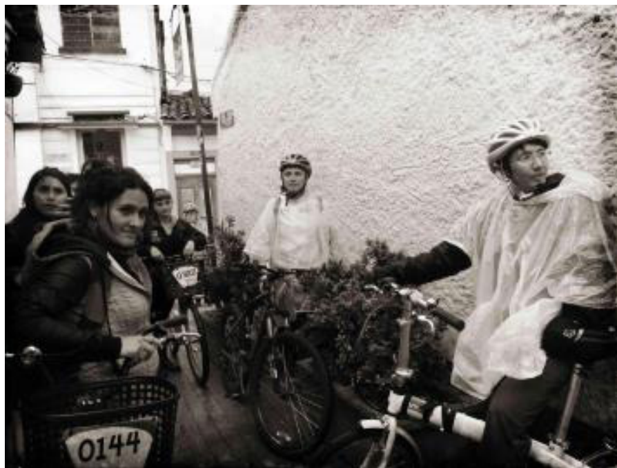
Figura 5. Bicicorrido en estación Callejón de las Brujas (Carrera 1A con Calle 13).

El grupo asistente, reducido en número para la expectativa de la convocatoria, fue receptivo para entender la incorporación en la construcción de un protocolo para el mejoramiento de barrios incluyente de los enfoques. El bicicorrido (Figura 4) se centró en explicar desde la memoria ejemplos de cómo las mujeres habitan de manera diferente el territorio y sus aportes invisibilizados en la vida barrial.