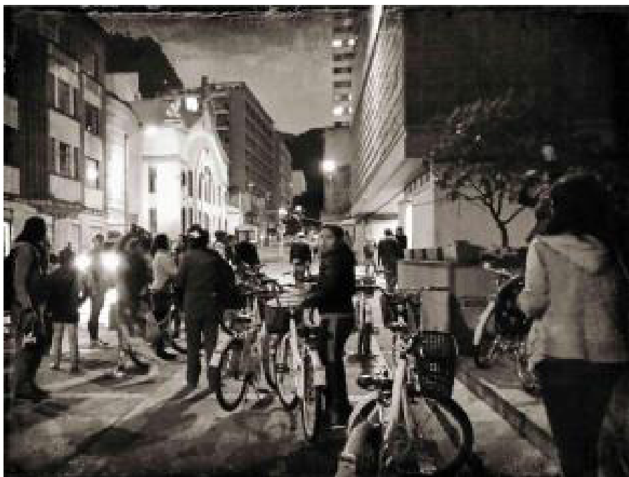
Figura 7. Cierre del bicicorrido al despuntar la noche.

Por último, para la sostenibilidad de estas iniciativas, la de subirse a la bici como hábito permanente y la de promover más bicicorridos , urge comprender la noche como territorio. El reto del bicicorrido contempla su realización durante la tarde y la noche (Figura 7) en un ejercicio práctico de recuperar la noche ante la abstinencia femenina para salir en horas nocturnas que han traído la inseguridad y las condiciones de vulnerabilidad de un urbanismo ajeno a los asuntos de género. Las marchas que desde los años setenta son recordadas, convocadas y conocidas como “Reclama la noche” o “ Take back the night ”, ante el acoso callejero (Kearl, 2015: 44), promovidas por activistas feministas a nivel mundial, son manifestación viva de la problemática vigente que afecta diferencialmente a las mujeres. En la conquista del afuera, de ampliar y superar fronteras, y de habitar la noche, la bicicleta suma en la exigibilidad de los derechos adquiridos por y para las mujeres, en igualdad de oportunidades y en equidad de género a procurar en las ciudades.