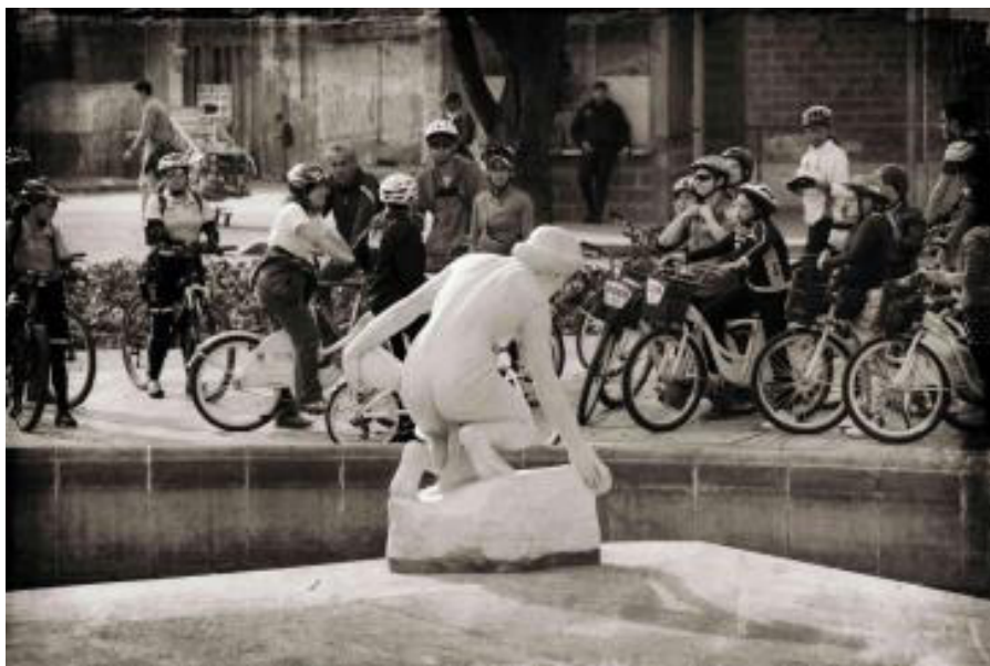
Figura 3. Bicicorrido en estación La Rebeca (Calle 26 con Carrera 13).