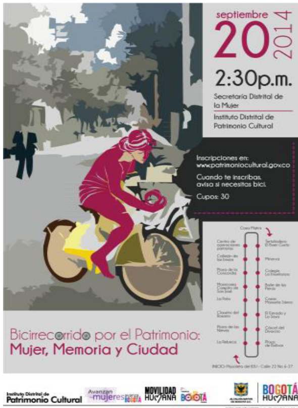
Figura 1. Pieza comunicativa de la convocatoria al primer bicirecorrido patrimonial por la Zona Centro de Bogotá.