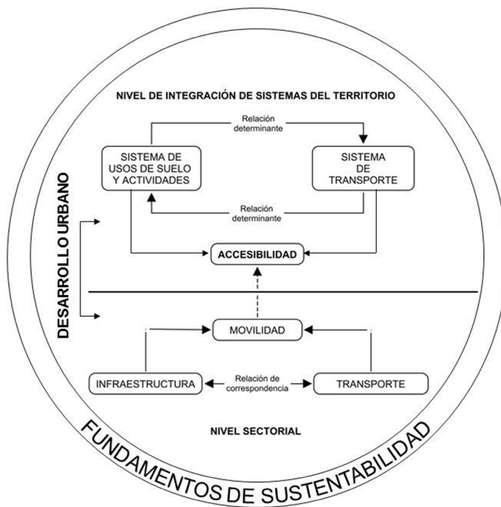
Figura 1. Relaciones a considerar para aplicar fundamentos de sustentabilidad al desarrollo urbano en distintos niveles.

En adición a esto, Whitelegg (1997) señala que un sistema de transporte sustentable también se enfoca en la equidad como un componente importante de la sustentabilidad, por lo que las políticas de transporte también deberían preocuparse por reducir las inequidades en el consumo de recursos finitos entre países desarrollados y en desarrollo, así como entre los individuos y grupos en una sociedad.