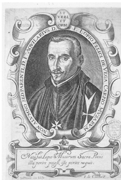
Figura 4 (izquierda).