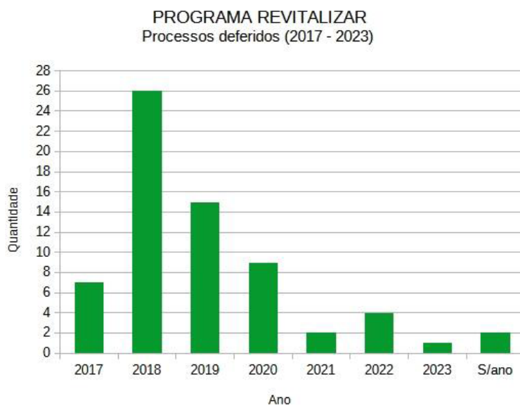
Figura 2. Programa de Incentivo à Restauração e Recuperação de Imóveis do Centro Antigo de Salvador - Revitalizar. Gráfico elaborado pela autora.

de projetos habilitados, entre 2017 e 2023, pelo Programa de Incentivo à Restauração e Recuperação de Imóveis do Centro Antigo de Salvador (Revitalizar), criado em 2016 pela prefeitura de Salvador (Figura 2):