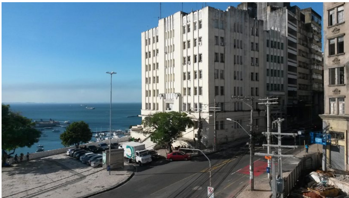
Figura 4. Palácio dos Esportes (foto digital, 2011).

Outro edifício público estadual, de grande porte, que passou para o setor privado, dessa vez por venda direta, foi o Palácio dos Esportes (Figura 4). Inaugurado em 1935, em estilo Art Decó ele – assim como o Palácio Rio Branco – fica em uma posição privilegiada com relação aos atributos mais cobiçados pelos investidores do setor de turismo e da indústria cultural: localização em um sítio histórico, com vista para o mar e boa infraestrutura urbana. No dia 08/03/2022, o Palácio foi arrematado em leilão por 9,1 milhões, pela empresa Castelo Empreendimentos Turísticos Ltda. A venda do Palácio só foi viabilizada em decorrência de uma nova lei, aprovada na Assembleia Legislativa da Bahia, Lei Nº 14.304 de 12/02/2021, que autorizou, ao governo do estado, a alienação do imóvel, para “implantação de empreendimento turístico”.