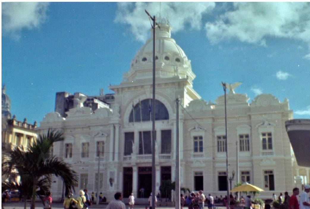
Figura 3. Fachada do Palácio Rio Branco voltada para a Praça Municipal (Foto analógica, filme colorido, 35 mm, 2011).

O Palácio Rio Branco (Figura 3), objeto dessa Manifestação de Interesse Privado (MIP), é um dos edifícios mais imponentes do Centro Histórico e dentro da Área de Proteção Rígida (APR). Mas são os aspectos históricos que fazem dele um edifício tão importante. Localizado na Praça Municipal, ele foi a primeira Casa dos Governadores construída por Tomé de Souza, primeiro governador do Brasil, fundando esse edifício junto com a cidade, capital da então colônia portuguesa, em 1549. O Palácio, corresponde a última versão do edifício, pois, mesmo que tenha passado por mudanças, ampliações e reformas – que acompanhavam a evolução cultural da cidade –, ele ocupa o mesmo local desde a sua fundação.