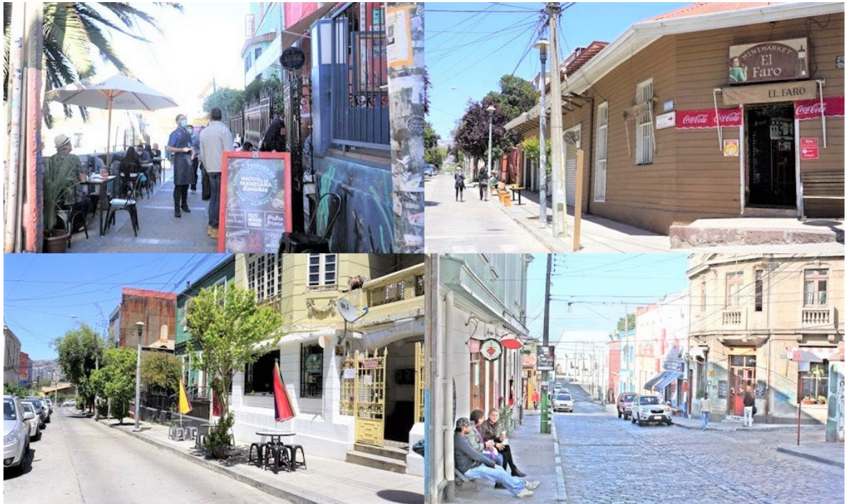
Figura 4. El paisaje urbano turistificado de los cerros Concepción y Alegre es uno de los cambios experimentados a partir de la aplicación de programas y subsidios.

el mismo sector, entonces tuvieron que emigrar a otro sector. Uno no puede prohibirle que el dueño de la propiedad haga algo, pero tiene que ser con armonía con el sector. (Dirigente vecinal, Playa Ancha bajo)