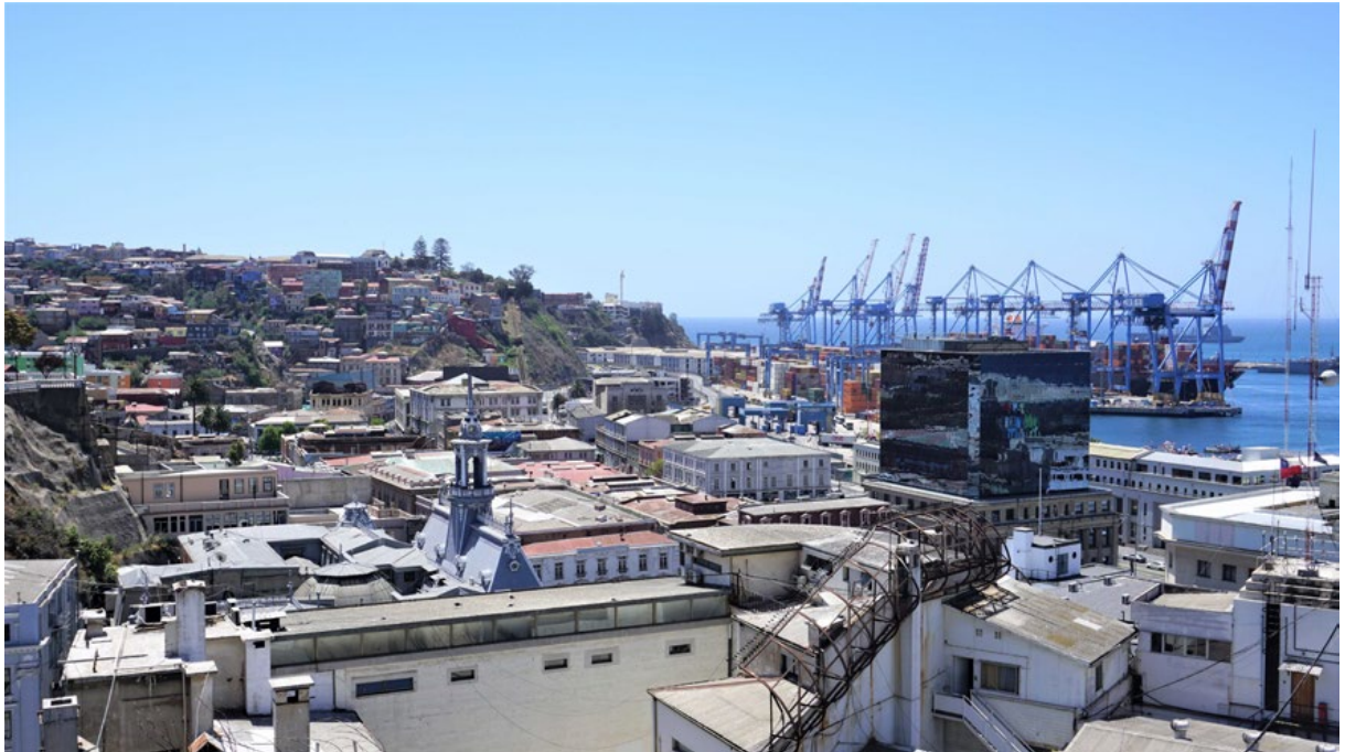
Figura 2. Vista hacia el barrio puerto de Valparaíso. Se trata del sector que hoy no ha experimentado procesos de turistificación.

Valparaíso patrimonio Unesco: turistificación dirigida por el... CÉSAR CÁCERES SEGUEL