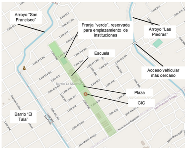
Figura 2. Barrio La Matera: disposición territorial y principales instituciones.

Estado, mercado, necesidad. Representaciones sociales sobre la... JAVIER NUÑEZ