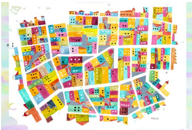
Over view. Serie "Polis". Acuarela sobre papel. 62 cm x 80 cm., 2019.