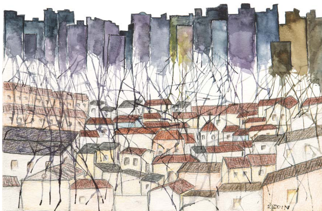
Tempos permeáveis. Série Polis. Acuarela y lápiz sobre papel. 60 x 48 cm, 2017.