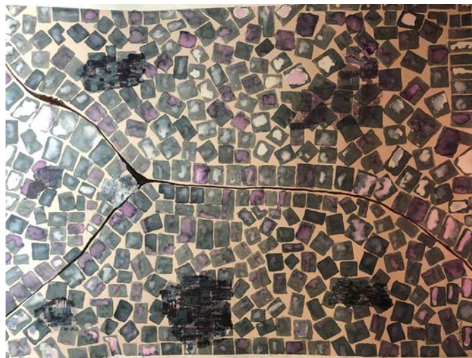
Big Shantytown 2. Serie "Polis". Ecoline sobre papel. 42 cm x 60 cm., 2018.