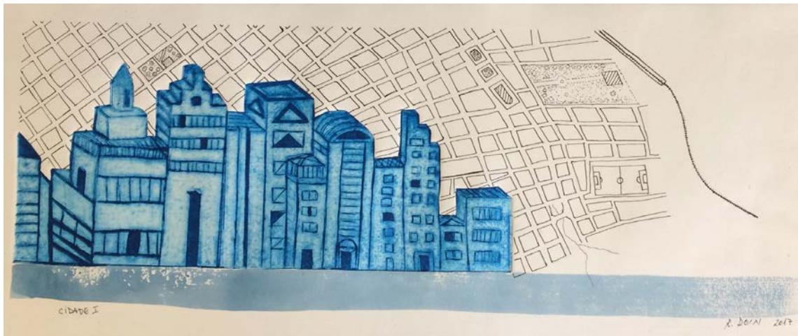
Fora do mapa. Serie "Skyline". Acuarela, grabado y tinta sobre papel. 49 cm x 18 cm, 2017.