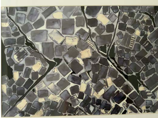
Shantytown 1. Serie "Polis". Ecoline sobre papel. 50cm x 62 cm., 2018.