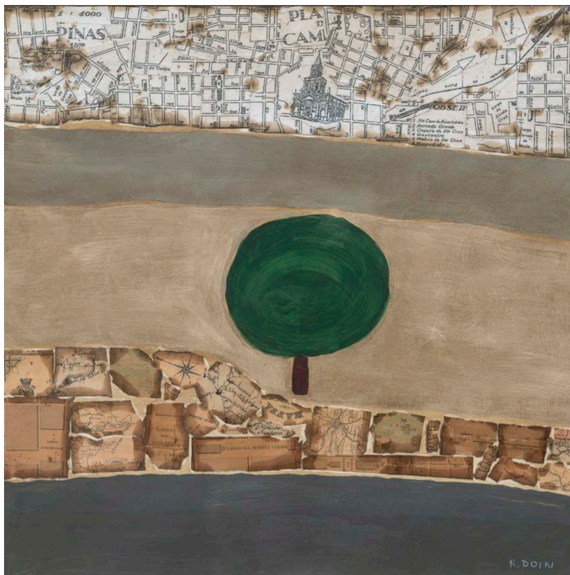
Espaço e tempo de Thomaz Perina. Serie "Polis". Pintura y collage sobre papel. 75 cm x 75 cm, 2016.

Las ciudades de Rosângela Doin ROSÂNGELA DOIN, VERÓNICA HOLLMAN