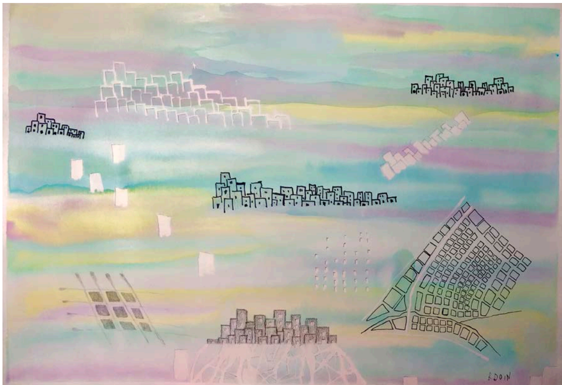
Cidade etérea. Serie "Polis". Ecoline sobre papel. 62 cm x 80 cm, 2018.