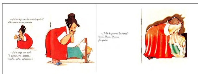
Imagen 16. Te quiero un montón (Chandro y Torcida, 2004). Versión digitalizada por docentes. Visualización de la obra digitalizada eligiendo la opción "vista de dos páginas" desde un lector de PDF.

Sobre la eliminación de páginas. Haber evidenciado la ausencia de páginas en las obras digitalizadas nos ha llevado a pensar en lo que los y las docentes priorizan de una obra de literatura infantil, y es que en ningún caso se suprimieron bloques de texto, sino que fueron espacios en blanco e ilustraciones las que fueron prescindibles. Si bien cuando estamos frente a un libro ilustrado lo relevante tiende a ser el texto, en los libros álbum, no hay jerarquías entre los elementos que ocupan el espacio gráfico, pues entre todos se construye el sentido de la obra (Arizpe, 2005; Guerrero Guadarrama, 2020) y la manipulación de alguno puede romper las intenciones literarias detrás de su construcción semiótica, por ejemplo, se puede limitar el acceso a los espacios de indeterminación que los autores-ilustradores crean a fin de ser llenados por las interpretaciones de los lectores (Iser, 1980). Esto, además nos hace pensar en el posible uso que docentes hacen de los libros de literatura infantil, pues con la preferencia por los textos podemos inferir que en la interacción con este tipo de obras lo que se promueve es la lectura, pero no la observación, ni la integración iconotextual.