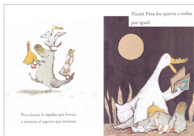
Imagen 1. Guyi Guyi (Chen, 2006). Versión digitalizada por docentes.