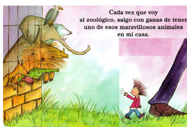
Imagen 5. Un Zoológico en casa (Andricáin y Cuéllar, 2006). Versión digitalizada por docentes.