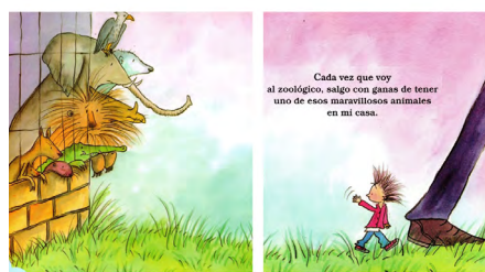
Imagen 6. Un Zoológico en casa (Andricáin y Cuéllar, 2006). Versión impresa, consultada en biblioteca.