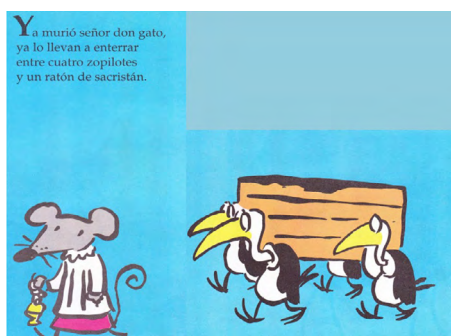
Imagen 15. El señor don gato (Corona y Trino, 1992). Versión digitalizada por docentes.