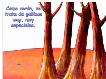
Imagen 11. Lola (Loufane, 2004). Versión digitalizada por docentes.