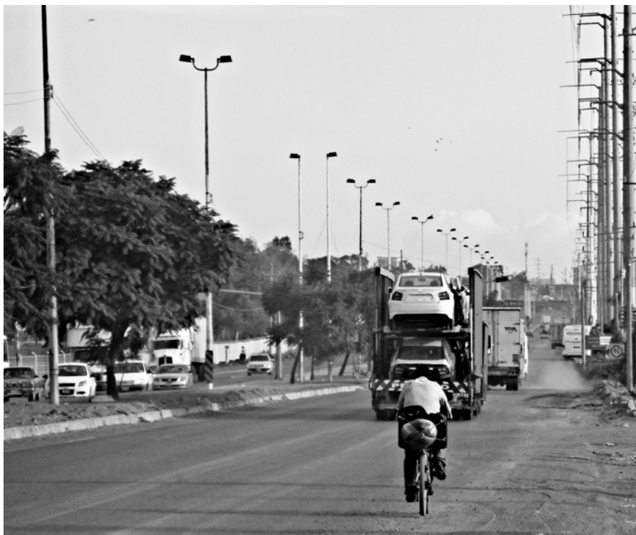
Figura 2. Ciclista en medio del tráfico del Corredor Industrial de El Salto.